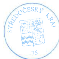
razítko Středočeského kraje