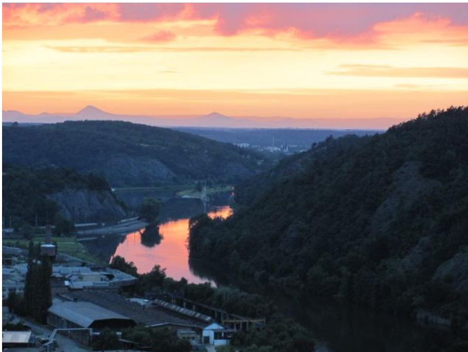
Foto: Krásný výhled z Větrušic - r. 2013

Informace o dění ve Větrušicích a okolí najdete také na