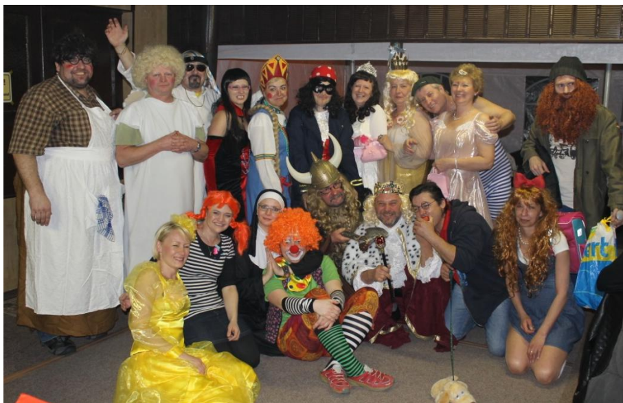
Foto: Dospělácký karneval ve Větrušicích, 29. 3. 2014

Informace o dění ve Větrušicích a okolí najdete také na