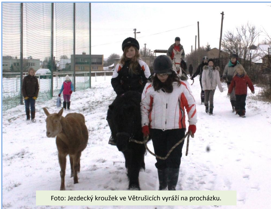
Foto: Jezdecký kroužek ve Větrušicích vyráží na procházku.