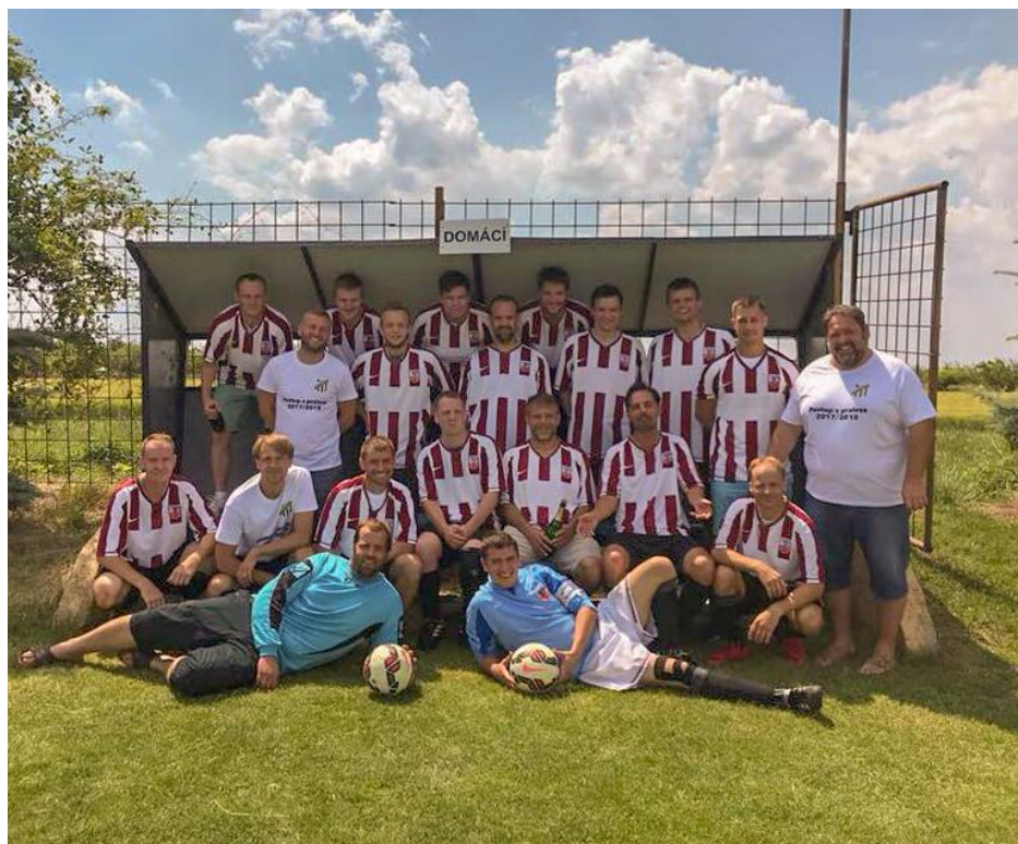
Foto: Větrušický fotbalový tým 2018